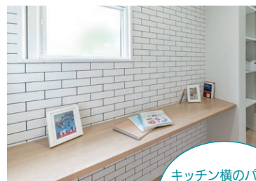
キッチン横のカウンター ※施工イメージ